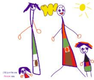
Table de concertation Petite Enfance Kateri

La TPEK regroupe des acteurs publics, parapublics et communautaires qui interviennent auprès de la petite enfance et de la famille. La Table a pour mandat d'identifier les besoins des enfants et des familles pour équilibrer les chances pour tous de se développer au même niveau. Elle vise aussi à outiller les intervenants pour réduire les facteurs de vulnérabilité des enfants. Cette année le Centre s'est investi dans le comité planificateur familial et la conception de la marionnette Chaminou.