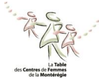
Table des centres de femmes de la Montérégie (TCFM)

Regroupant les centres de femmes de la Montérégie qui sont membres de L'R, cette table est le lieu de coordination des actions, de transmission d'informations, de formation et de soutien entre les centres. Son rôle principal est de faire le pont entre le comité de coordination de L'R et les centres. En 2018-2019, le Centre s'est investi dans le comité d'intégration d'un nouveau membre au sein du réseau. Il participe également au comité de partenaires ADS/Parité qui a pour objectif de travailler avec les municipalités et les MRC de la Montérégie afin qu'elles adoptent une politique égalité. De plus, une travailleuse et une membre du CA ont participé au congrès annuel.